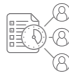
PLANUNG UND VERGABE